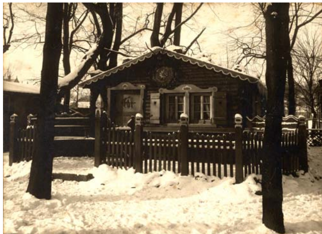
Vereinshütte der Sektion Zweibrücken von 1909 bis 1945